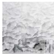
VARIATIONS Papier peint Wallpaper