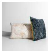
JUNGLE Coussin Cushion