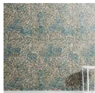
VOLUTES Papier peint Wallpaper