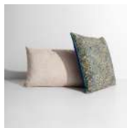
VOLUTES Coussin Cushion